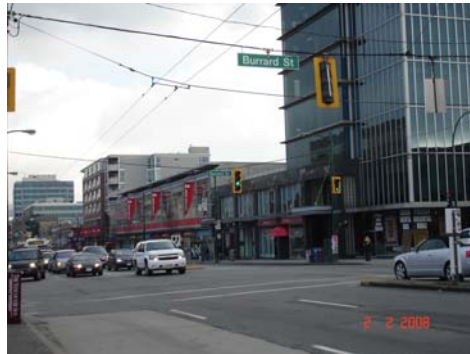
นี่ไงจะ รถเมล์ที่ใช้ระบบไฟฟ้ามีเสากระโดงทำยอด