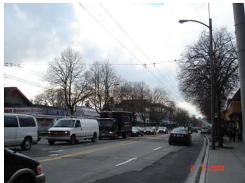
สองรูปนี้ก็เหมือนกันจะ จะเห็นสายไฟฟ้าจึงลอยอยู่